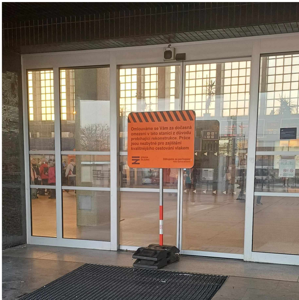
Příloha 1 - fotografie