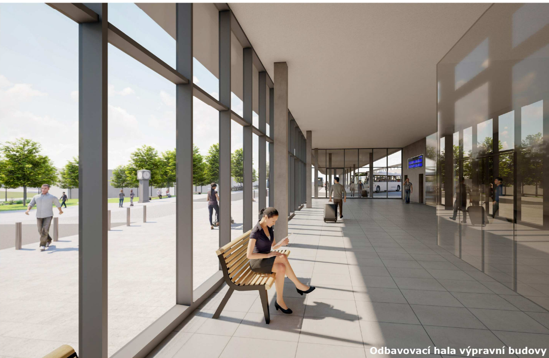
Odbavovací hala výpravní budovy