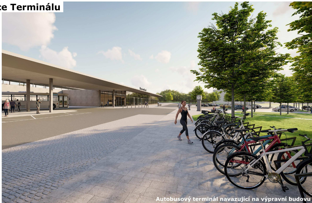
Autobusový terminál navazující na výpravní budovu