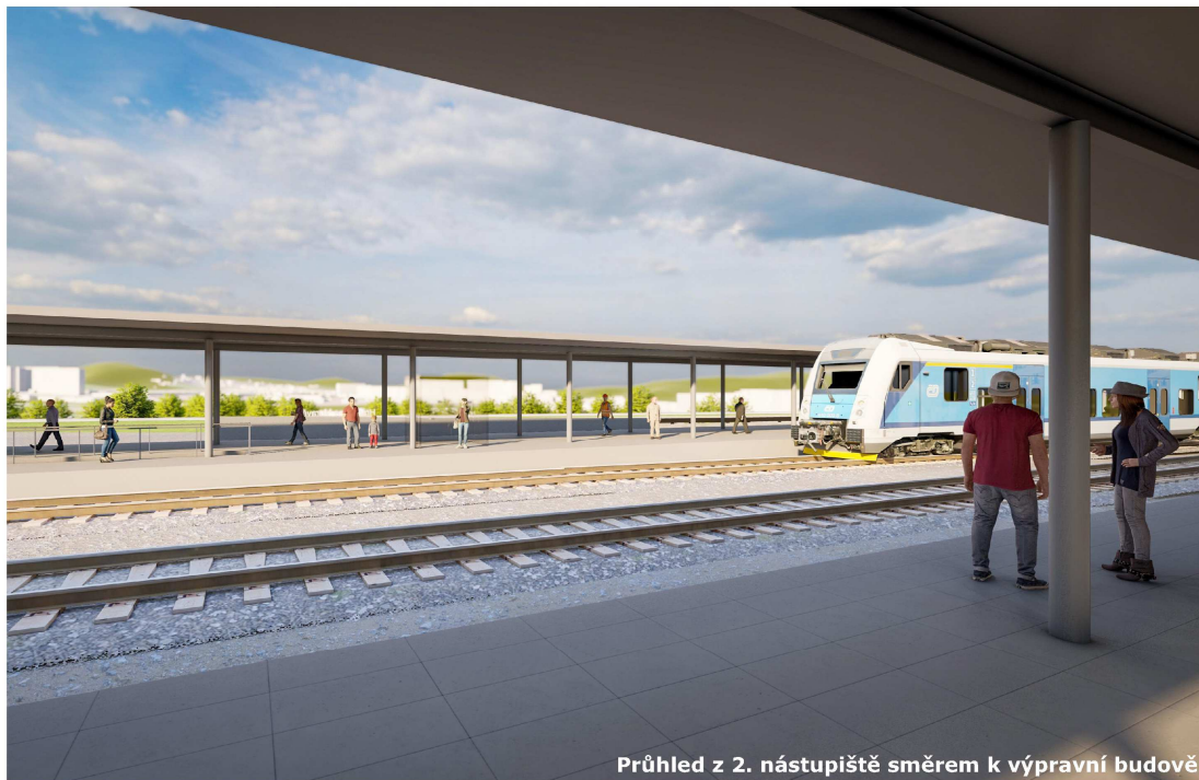
Průhled z 2. nástupiště směrem k výpravní budově