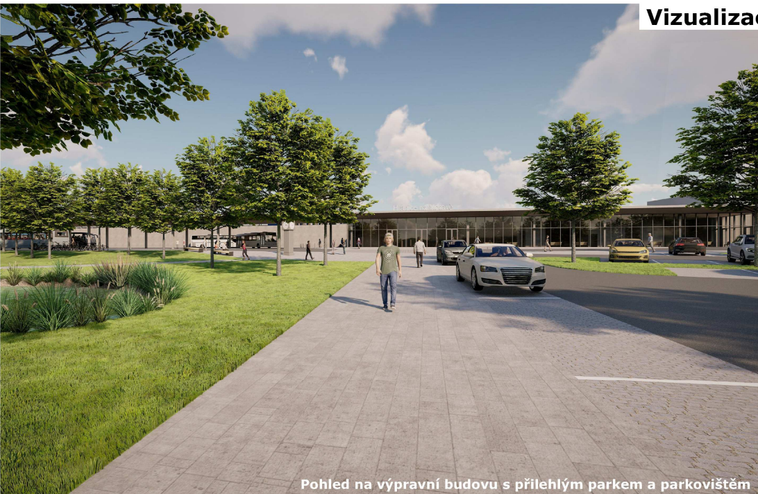
Pohled na výpravní budovu s přilehlým parkem a parkovištěm