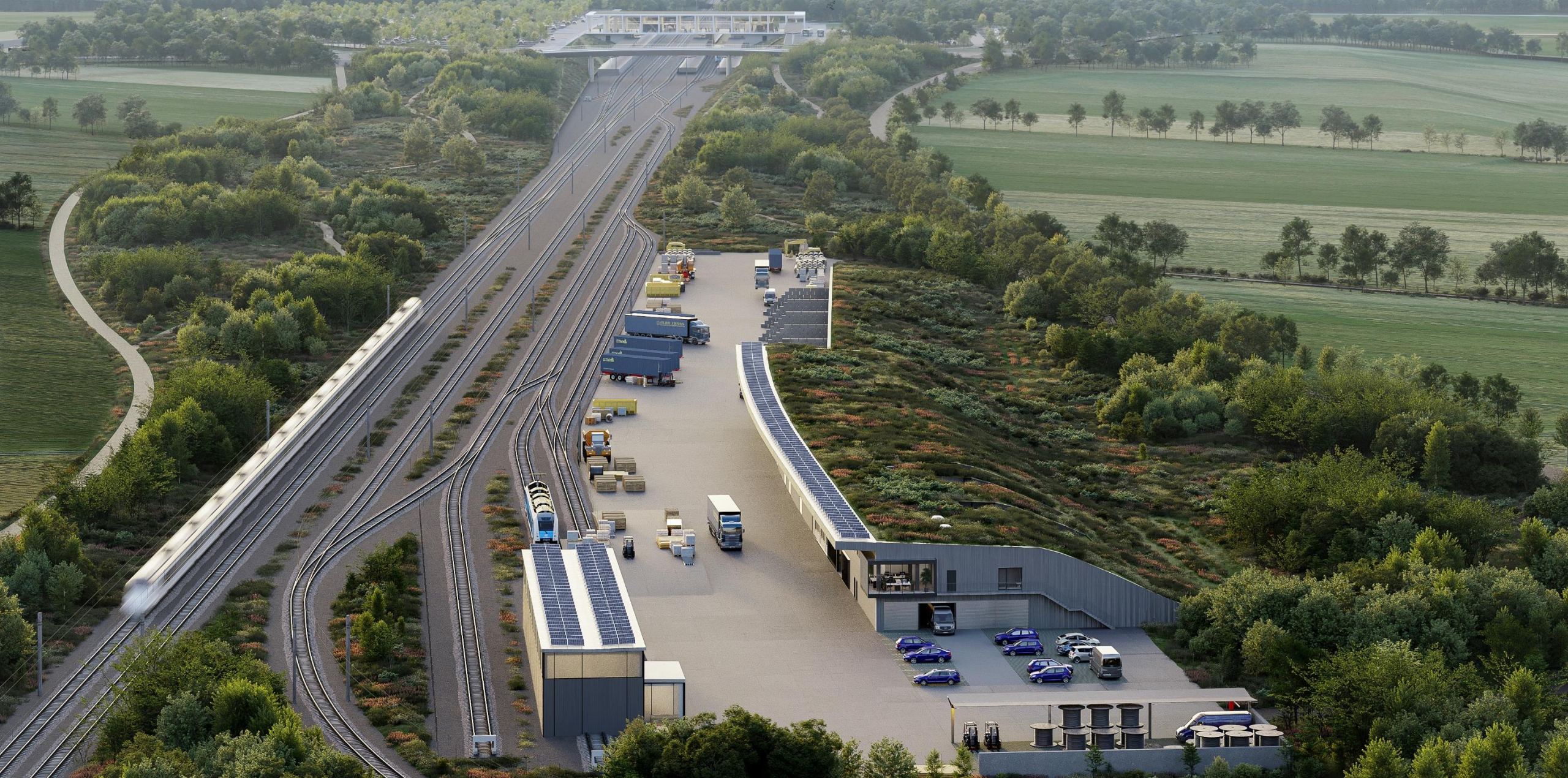
Roudnice nad Labem VRT – údržbová základna