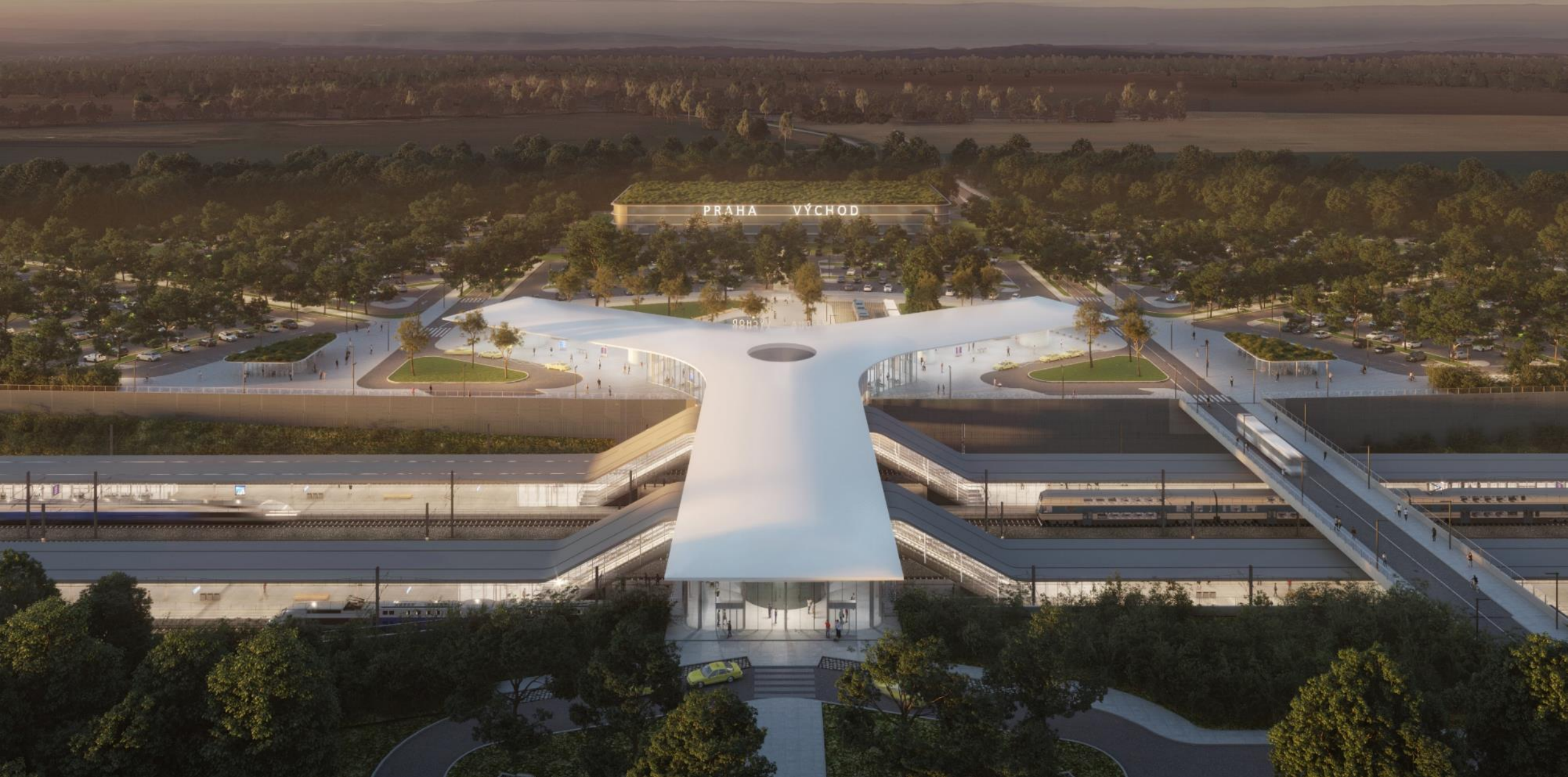
Praha východ VRT