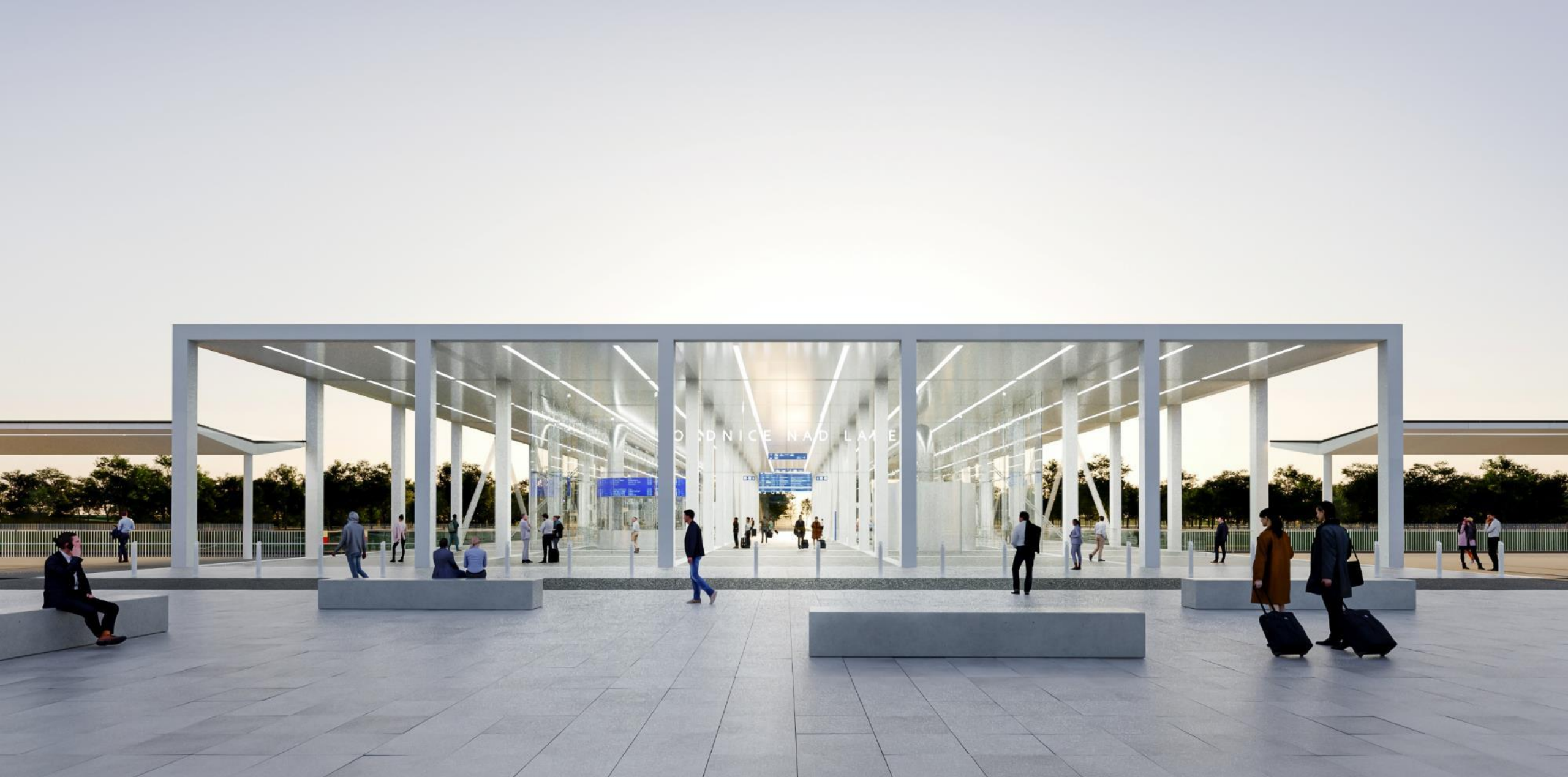
Roudnice nad Labem VRT